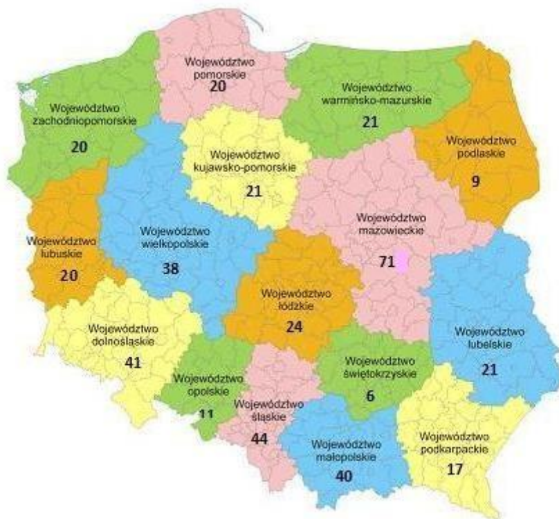
Liczba Uniwersytetów Trzeciego Wieku wg województw, grudzień 2012.